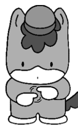
「手話」を表現している くんまちゃん