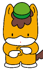
「手話」を表現している くんまちゃん