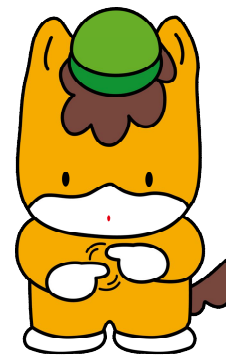
「手話」を表現している ぐんまちゃん