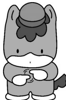
「手話」を表現している ぐんまちゃん

申込み・お問い合わせは、 群馬県聴覚障害者コミュニケーションプラザへ FAX 027-255-6634 電話 027-255-6633 メール info@gunma-comipura.jp