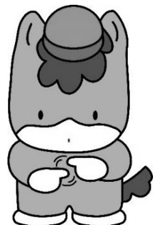
「手話」を表現している ぐんまちゃん

申込み・お問い合わせは、 群馬県聴覚障害者コミュニケーションプラザへ FAX 027-255-6634 電話 027-255-6633 メール info@gunma-comipura.jp